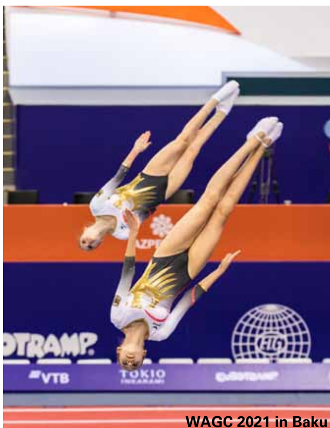
WAGC 2021 in Baku

Int. GymCity Open: Silber LVT-Pokal: Bronze Deutsche Mannschaftsmeisterschaft: Bronze Int. Filderpokal: Gold Teilnahme Jugend-WM Sofia, Bulgarien